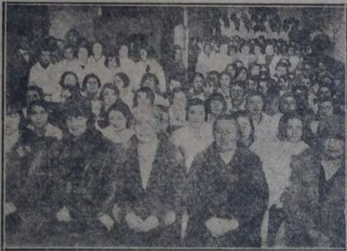
En la Escuela comercial de mujeres de la nación, Callao 629, escuchando a la doctora de Justo

El moderno movimiento cooperativo tiene sus orígenes en las Regias sentadas por los 28 tejedores de Rochdale, que en 1844, con un capital de 28 libras